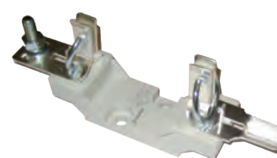
14 TORNILLO M8 + TERMINAL V BOLT M8 + V TERMINAL