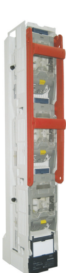
Conexión inferior Bottom connection