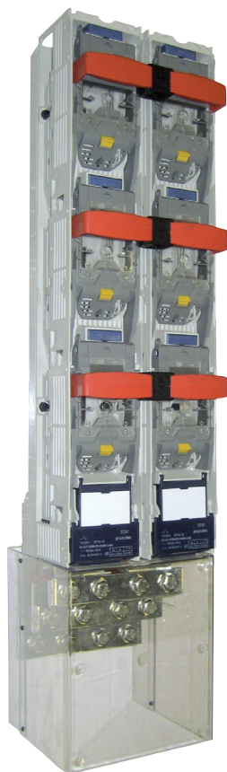
BTVC-DS SUPERIOR/INFERIOR REVERSIBLE BTVC-DS TOP/BOTTOM REVERSIBLE