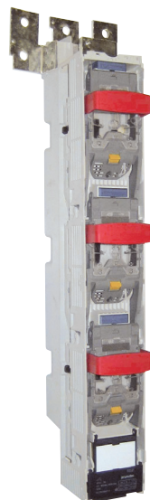
Conexión superior Top connection