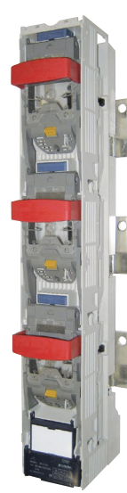
Seccionamiento de embarrado Busbar connection