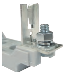
01 TERMINAL TORNILLO BOLT TERMINAL